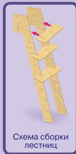
Схема сборки лестниц

и снимает с дерева (аккуратно роняя на лужайку через прорези) столько яблок, сколько очков выпало. Собранные яблоки игрок кладет перед собой. И так каждый ход игрок собирает яблоки, пока на дереве не останется ни одного.