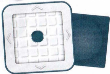
Скользящие фишки: Игровое поле и подставка